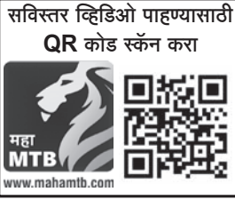
सविस्तर व्हिडिओ पाहण्यासाठी QR कोड स्कॅन करा

नाही. मात्र, आज आम्हाला स्वतंत्र डबा मिळाला याचा अत्यंत आनंद आहे. आम्ही बातम्यांमध्ये वाचले. मात्र, आज ही सुविधा प्रत्यक्षात बघून खूप आनंद वाटतो आहे,” असे ते म्हणाले.